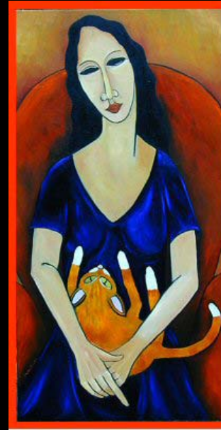
Woman with cat